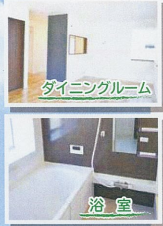
ダイニングルーム